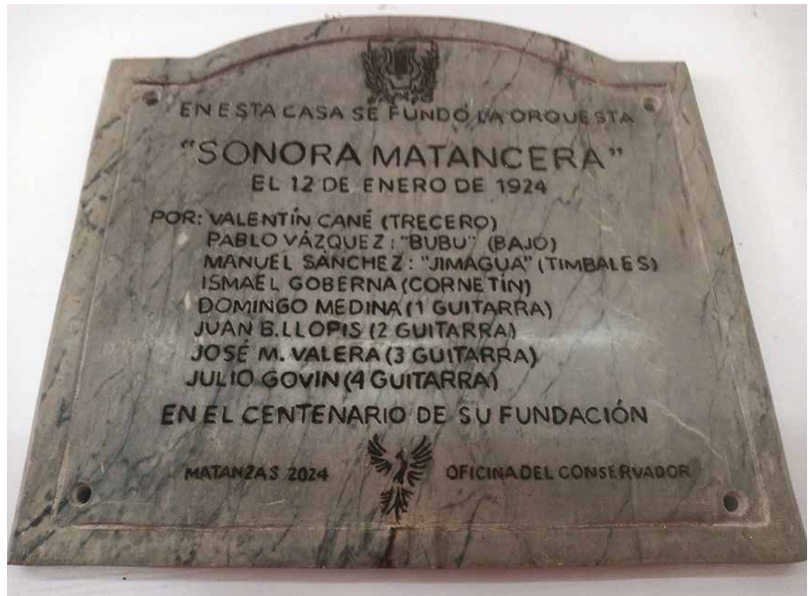
Placa conmemorativa destinada a la casa fundacional de la agrupación.

Con la coyuntura política de los 60, y un contrato en México de por medio, inicia el distanciamiento entre la nación y uno de sus símbolos musicales más emblemáticos.