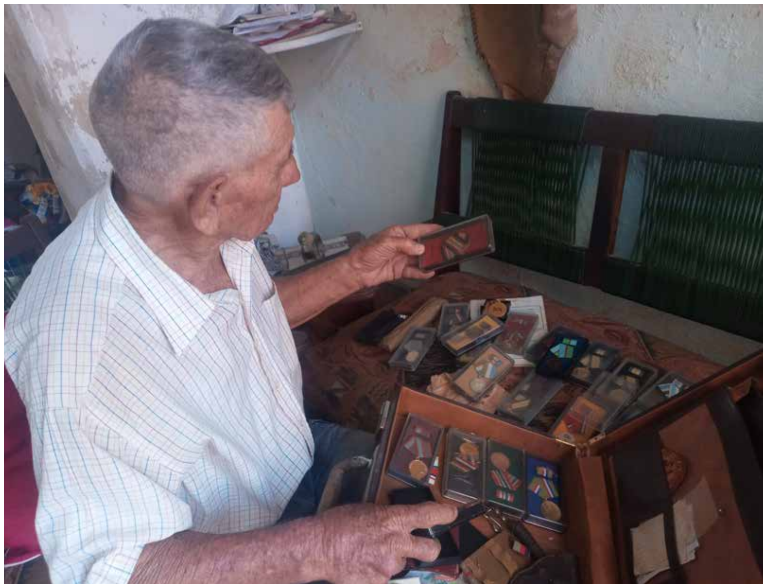
Muchas medallas, no solo de Girón, avalan la carrera de este combatiente.

Y, también por eso, el llamado a repeler una ofensiva