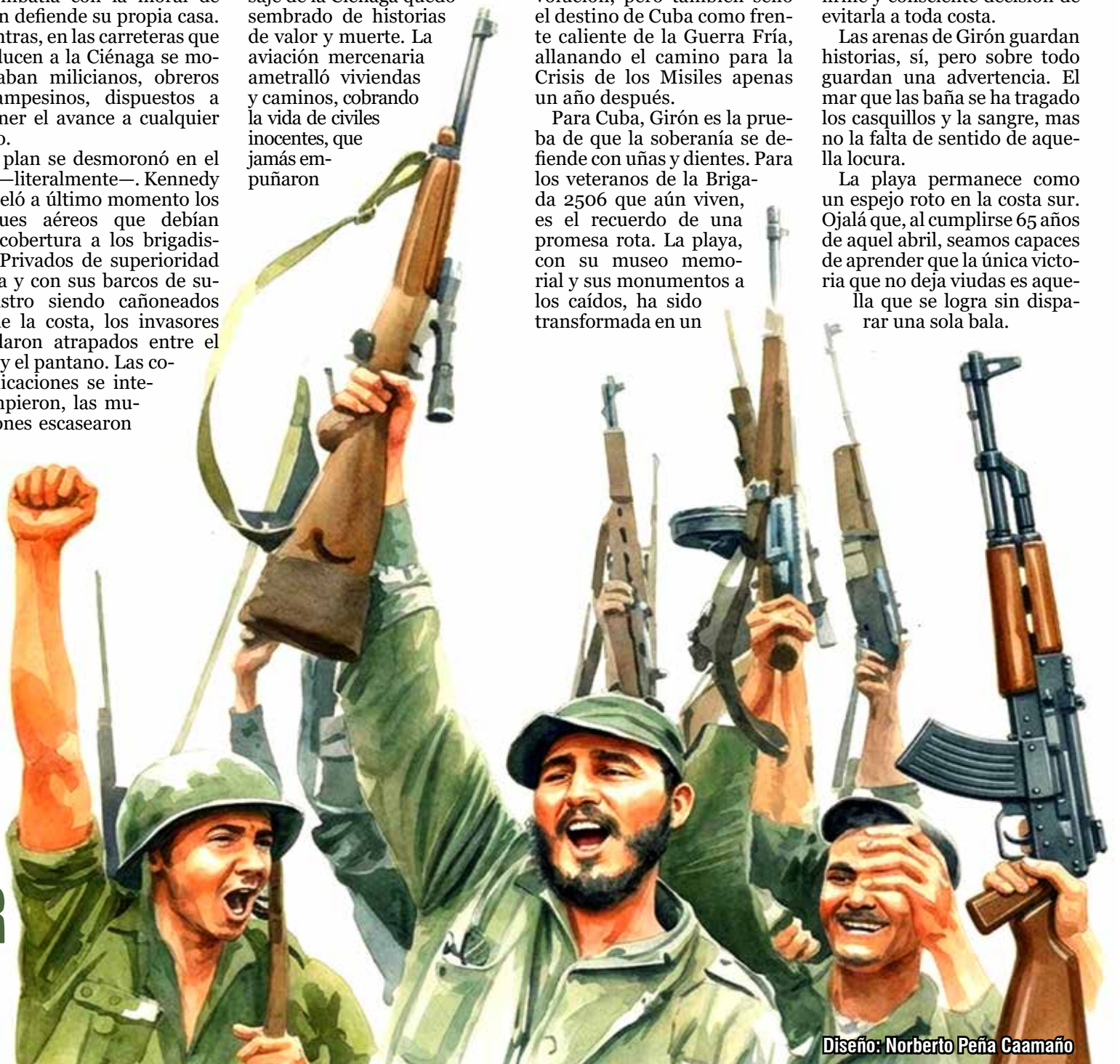
Diseño: Norberto Peña Caamaño

La playa permanece como un espejo roto en la costa sur. Ojalá que, al cumplirse 65 años de aquel abril, seamos capaces de aprender que la única victoria que no deja viudas es aquella que se logra sin disparar una sola bala.