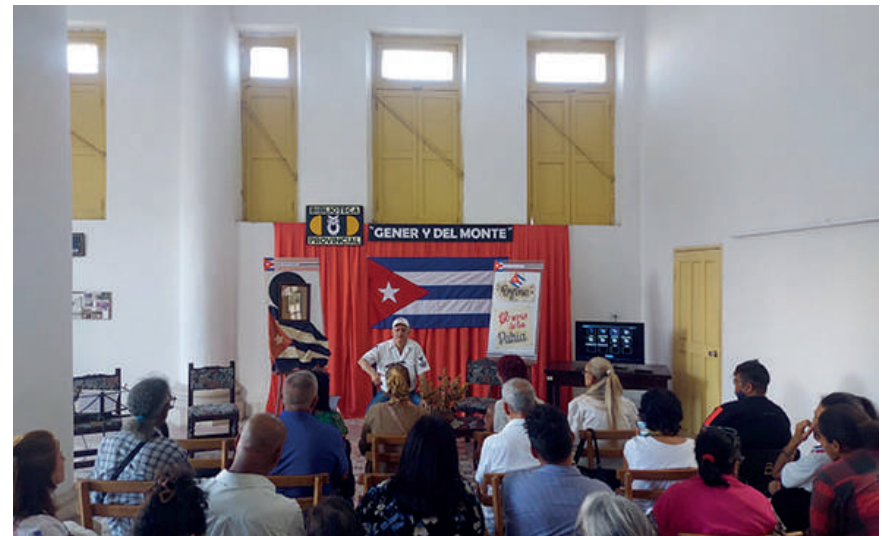
La jornada Marzo Literario se extenderá hasta el 8 de marzo.

tor de Marzo Literario, “esta iniciativa se genera para no pasar por alto el momento de la Feria del Libro, que este año no se pudo realizar por la situación del país”.