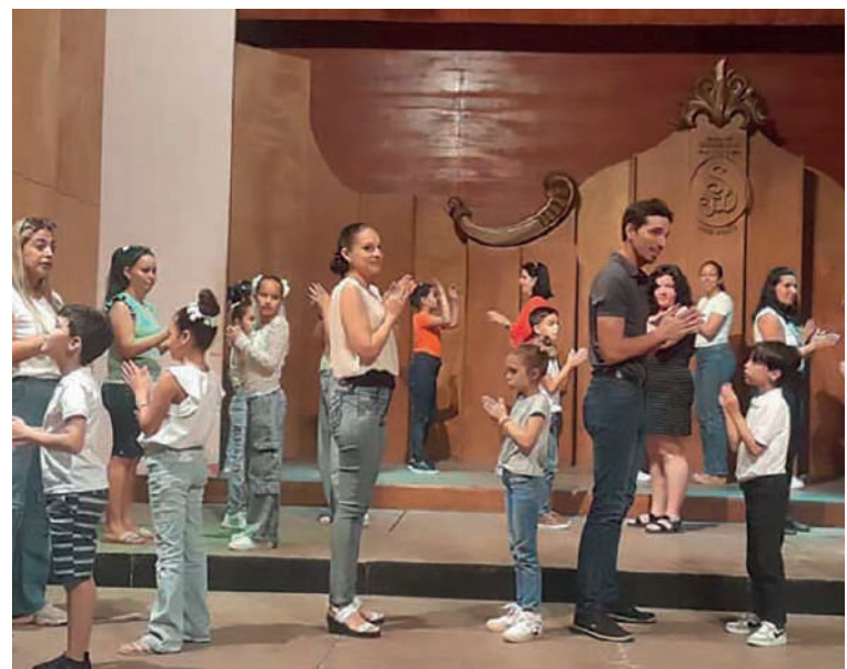
La Corcheita Verde mostró al público los resultados alcanzados durante el taller.