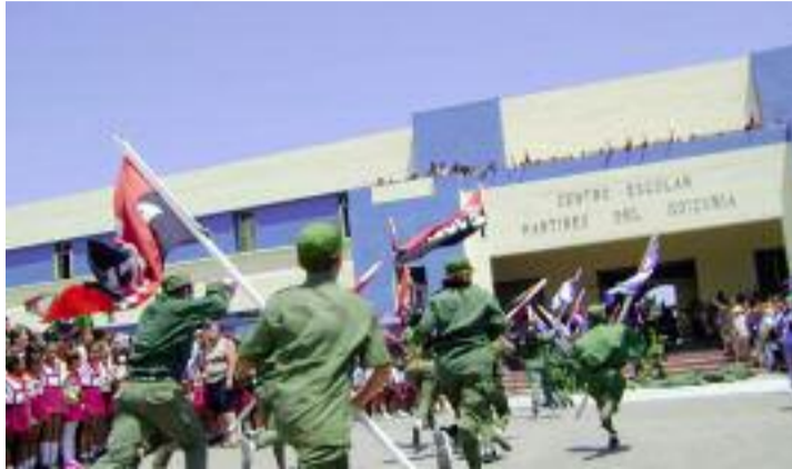
Cada 29 de abril, los pioneros rememoran simbólicamente el asalto al cuartel Domingo Goicuría.

Por los hechos del Goicuría la dictadura abrió la causa 37 de 1956 en la que aparecían 96 acusados, algunos de ellos, como Fidel Castro, estaban muy lejos de los hechos. El 16 de agosto de 1956, un poco después de