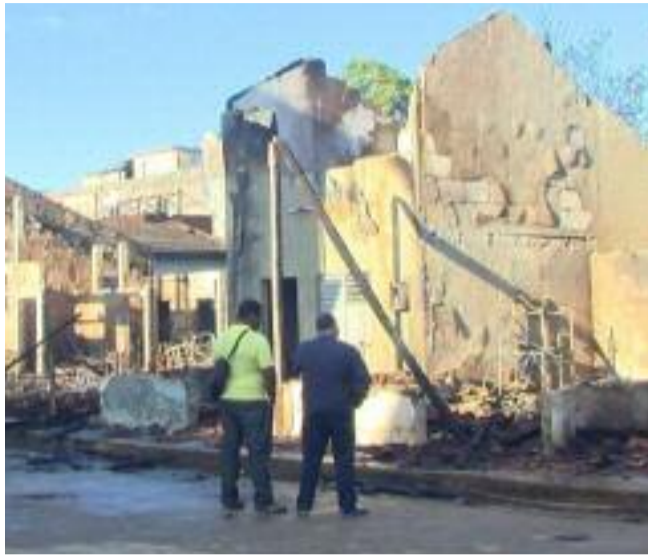
Durante el siniestro siete viviendas quedaron reducidas a cenizas y otras dos resultaron seriamente dañadas.

Tal fue el apoyo a los damnificados que si bien la hija de Ya-