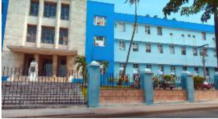
La reparación del hospital José Ramón López Tabranes ha sido priorizada con más de 2 000 000 de pesos.

Para este año, Matanzas tiene aprobados 41 000 000 de pesos, agregó la funcionaria, cuyo