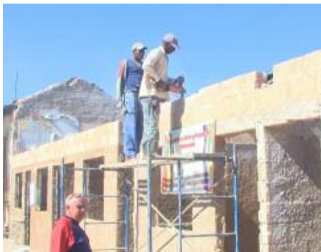
Perceptibles avances muestran las nuevas viviendas que se construyen para las familias afectadas.