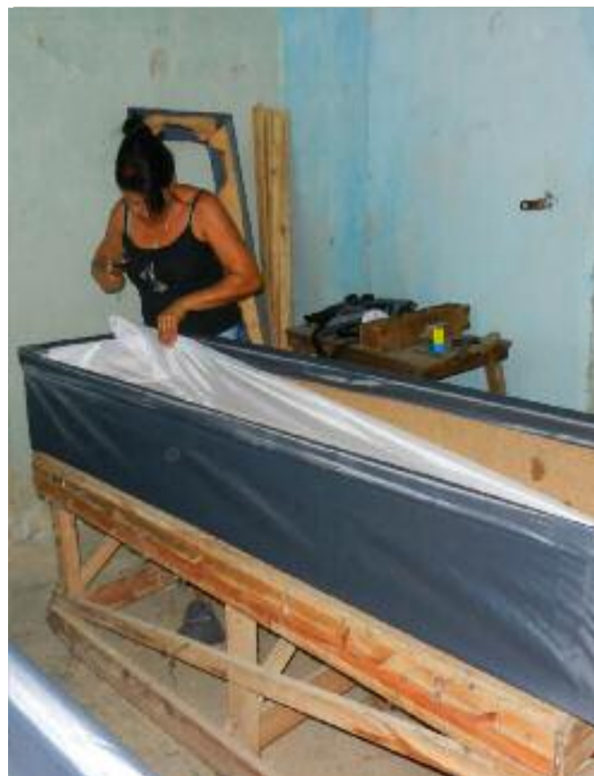
En la fábrica de ataúdes reconocen que el tejido para el tapizado no es el idóneo.

Sobre el tema el Semanario Girón continuará indagando, pues son muchos los inconvenientes que aún restan por abordar en un momento tan solemne y triste para los seres humanos.