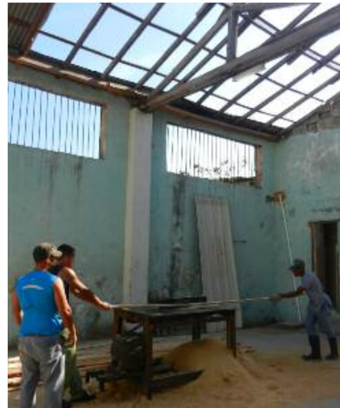
A pesar de las condiciones laborales y el bajo salario, el ritmo de trabajo de la fábrica de ataúdes es constante.

La madera, materia prima principal, posee estabilidad en la fábrica, algo que reconocen los trabajadores y que reafirman desde la Empresa Agroforestal Matanzas, perteneciente al