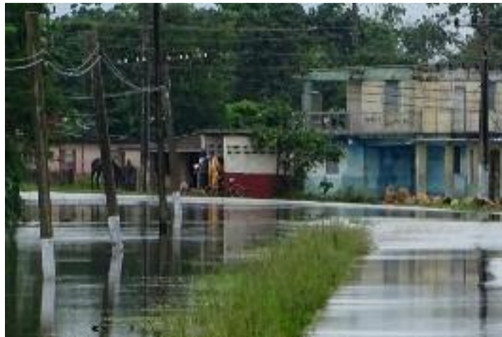
La situación creada por las intensas lluvias favorece la aparición de enfermedades diarreicas agudas y brotes epidemiológicos, por lo que resulta necesario extremar las medidas higiénico-sanitarias.

Más allá de las medidas preventivas aplicadas en los acueductos, Acebo Figueroa alertó sobre la necesidad de hervir el agua y añadirle hipoclorito de sodio antes de consumirla, so-