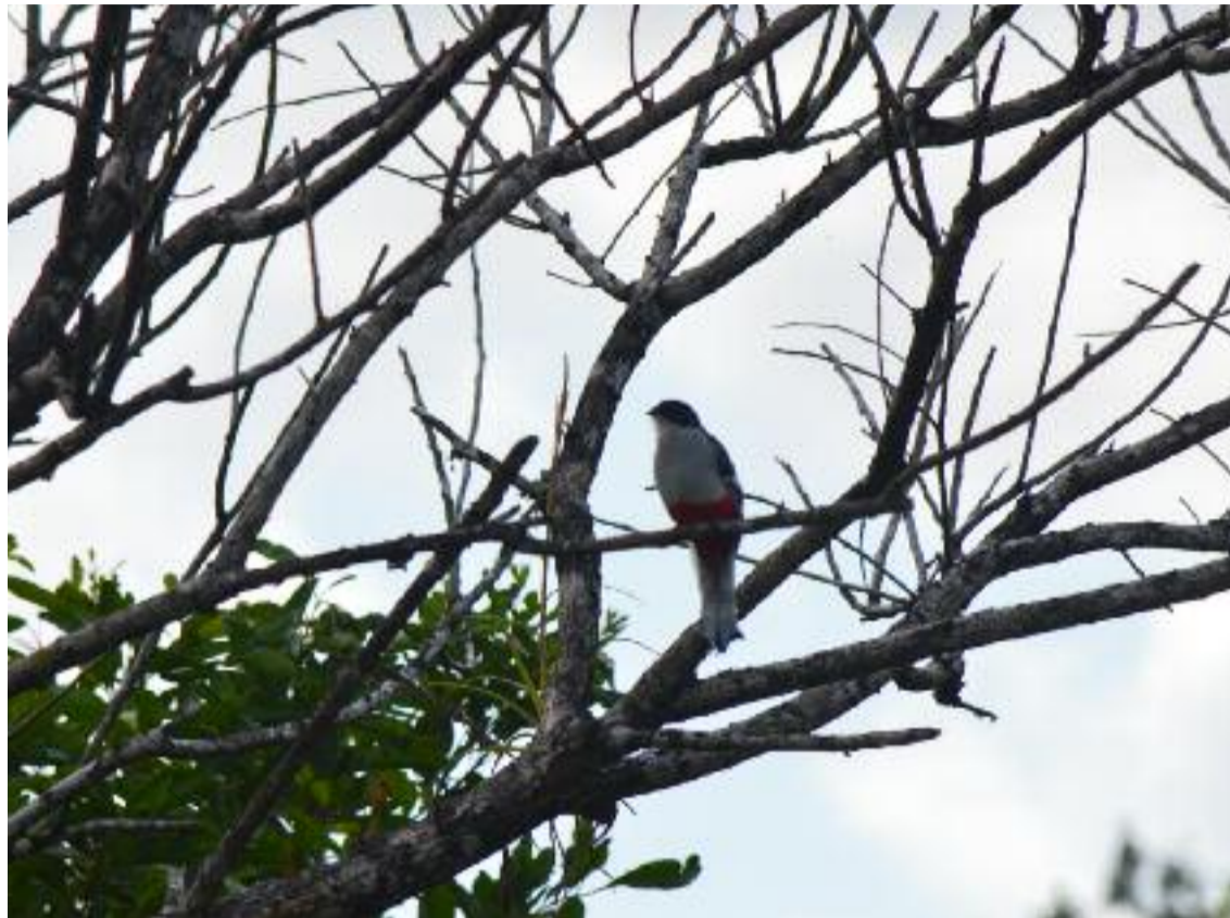
Cuidar el medio ambiente debe ser una prioridad diaria.

Podemos citar las firmas que aún siguen siendo estampadas en los muros de la Cueva de Bellamar, el vertimiento de desechos en ríos y en la bahía como si fueran vertederos, así como el uso de los bosques de la Ciénaga de Zapata como basurero, llenando los manglares y pantanos de plástico, latas y vidrios, elementos nocivos para la vida silvestre.