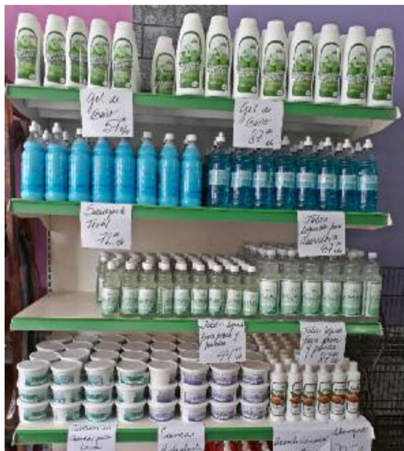
Un alto precio caracteriza a los artículos de aseo e higiene del hogar elaborados por Demos.

Quizás, una posible solución radicaría en que Demos pudiera obtener una licencia para vender sus propios productos a la población, y así los costos serían más razonables. No obstante, la directora de la entidad admite que esto solo sería posible si logran una asociación económica internacional que garantice la materia prima durante todo el año.