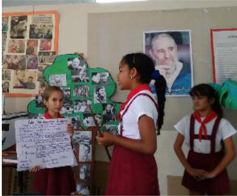
En numerosas actividades demuestran sus conocimientos para que todos aprendan sobre sus derechos.

Por este motivo, estas niñas no perdieron la oportunidad de dar a conocer parte de lo que han aprendido durante este tiempo en su círculo de interés.