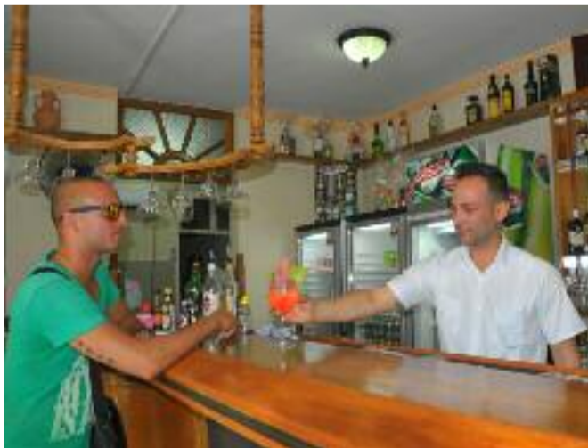
La Sala White obtuvo el primer lugar entre los centros culturales de baja complejidad.

puestos más relevantes como mejor punto de zona turística. (Ayose S. García Naranjo.)