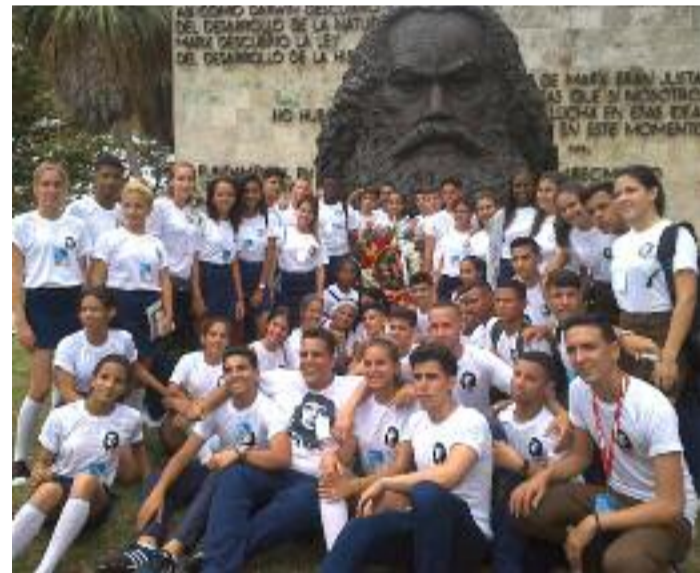
No faltó el homenaje a Carlos Marx en el marco de su bicentenario.