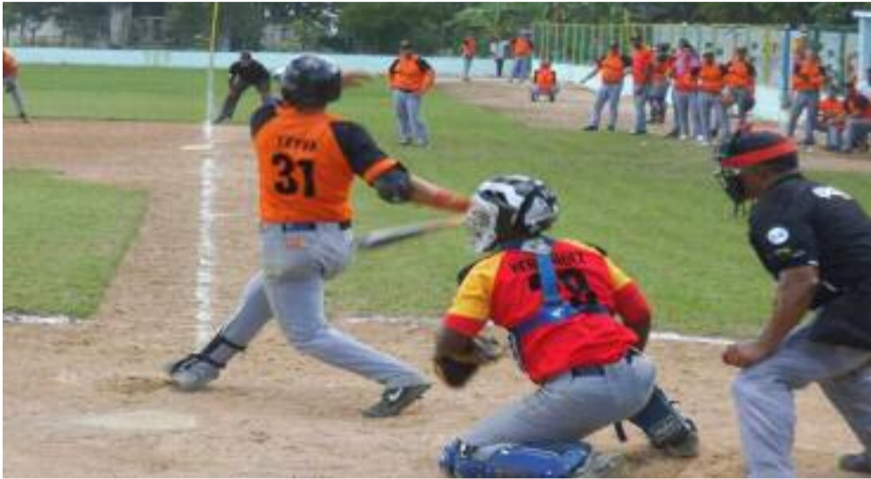
Los últimos juegos se proyectan como los más difíciles para los aspirantes a la clasificación en las tres zonas del país.

"Nuestros peloteros no están carentes de entrenamiento, pues muchos de ellos juegan en el equipo grande y muestran potencial, talento, pero necesitan jugar, y mucho, para