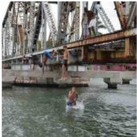
Estas imágenes resultan comunes ante la indiferencia de transeúntes y familiares.

Ciertamente, en la urbe yururina pueden resultar escasas las opciones recreativas para tales edades, pero si el gusto gira en torno a los desafíos y la naturaleza, existen opciones diversas que pueden tomar los jóvenes y que no representan una amenaza a su futuro. Entonces: ¿por qué es necesario jugarse la vida saltando a la muerte?