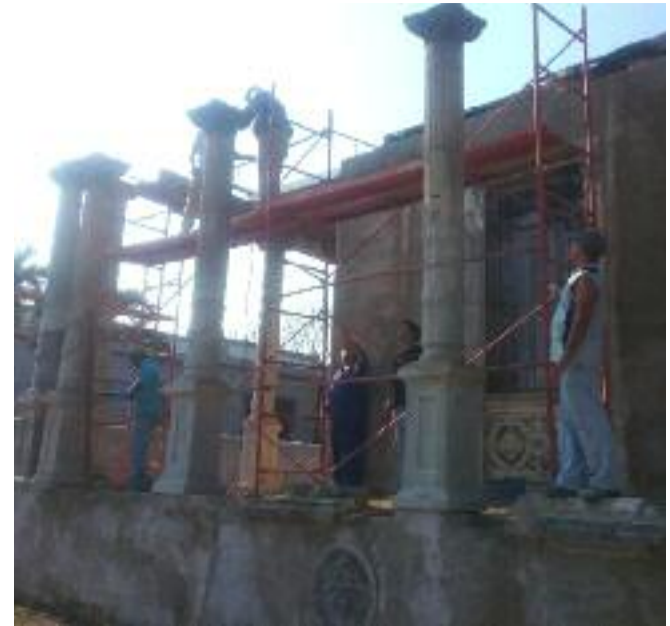
Obreros de la Empresa de Mantenimiento y Construcción del Poder Popular se esfuerzan por devolverle el antiguo esplendor a la quinta Villa Julia.

“La columna es el elemento que más sobresale en esta villa y desde el punto de vista estético resulta el más complicado a la hora de trabajarlo, porque lo conforman 16 piezas distintas.